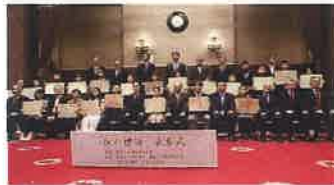
令和7年11月26日 於：神奈川県庁

神奈川区、港北区の小学生の皆さんから2,520点の応募をいただきました。ありがとうございました。