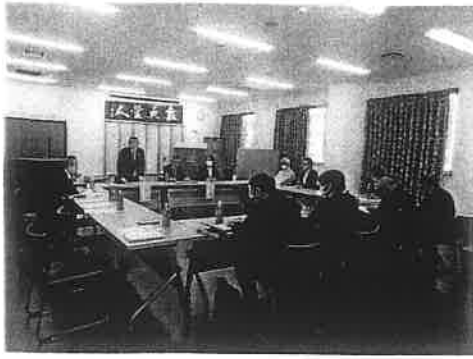
R7年4/15 役員会 つま正大ホール