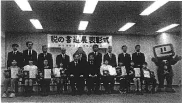
R7年11/25 税の書道展表彰式 神奈川税務署