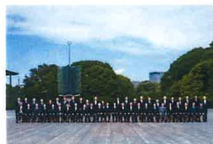
令和7年度 財務大臣納税表彰記念（於：皇居内） 0025-0023