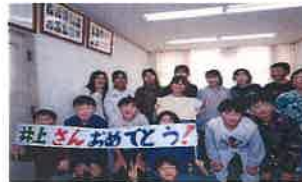
令和7年12月2日 於：羽沢小