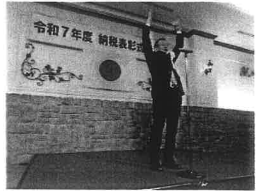
R7年11/13 納税表彰式万歳三唱 ソシア 21