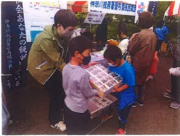
神奈川県民祭り (R4.10.9 反町公園)