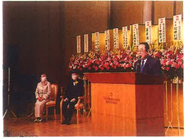
国税庁長官表彰受賞祝賀会 (R5.3.8 横浜ベイホテル)