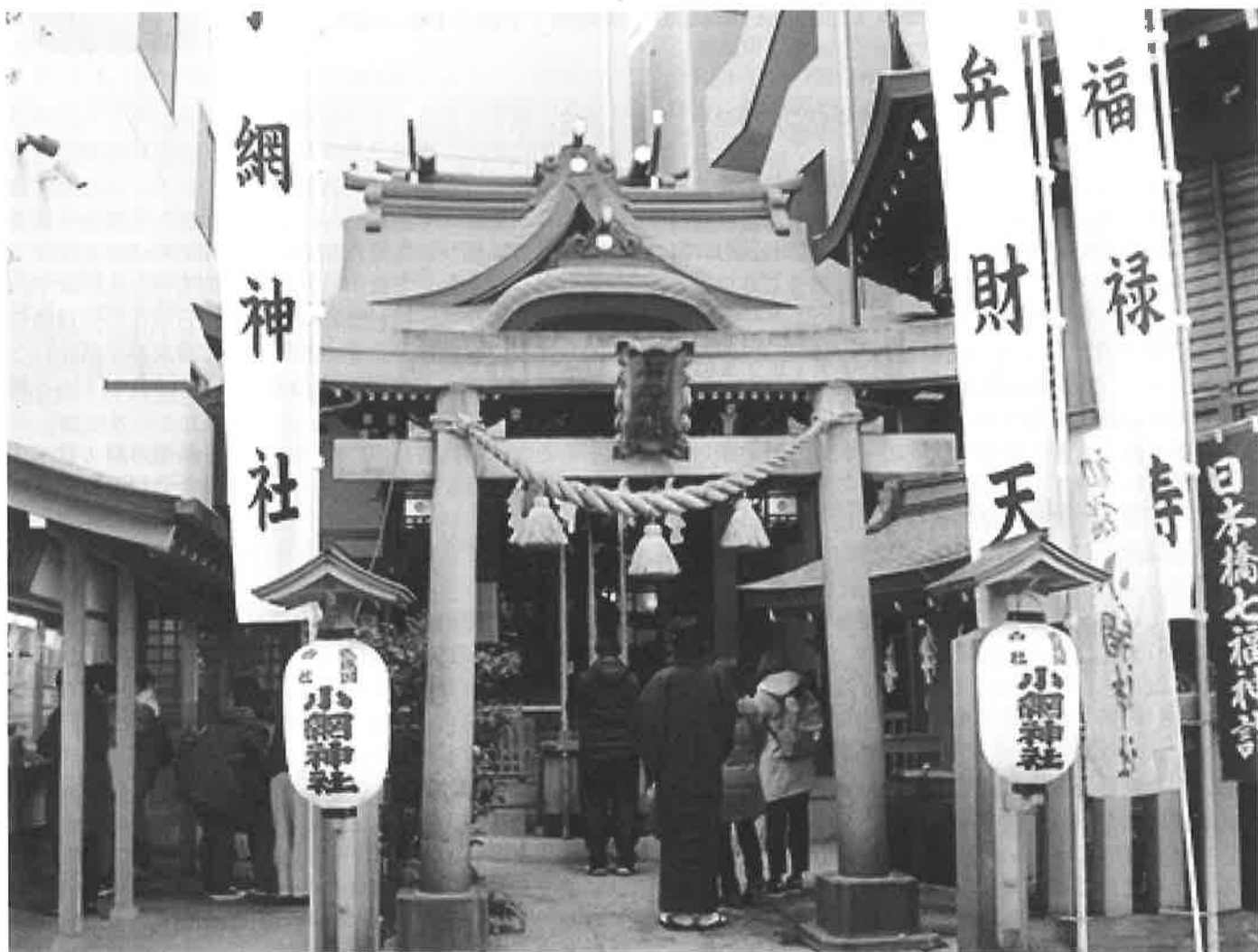
日本橋・小網神社(東京銭洗弁天)。

小さな神社ですが、財運向上や強運厄除のご利益を頂けるパワースポットとして有名で、全国から参拝する者が絶えません。