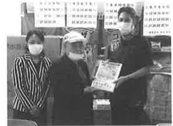
2021.11 沖縄市飲食業組合

税を考える週間を通して、沖縄中部間税会の会員はもとより、関係各位の皆様への健全な経営発展に寄与していくことが出来るよう、今後も取り組んでいきたいと思っています。