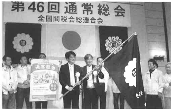
通常総会は第47回・第48回と開催なし。開催できれば写真のような力強く温かい引継ぎが実現。本年こそは第49回長崎大会の開催を願うばかりです。