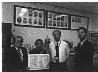
表彰伝達式 2020/12/10 神橋小学校

*本年度は新型コロナウイルス感染症対策により、神奈川県間税会連合会による募集、選考は実施されませんでした。