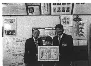
表彰伝達式 2020/12/10 小机小学校